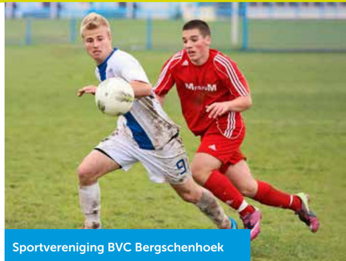
Sportvereniging BVC Bergschenhoek

Ondanks overheidssubsidie zijn sportverenigingen vaak afhankelijk van externe financiering. U heeft waarschijnlijk gemerkt dat het als non-profitorganisatie lastig is om leningen te krijgen via reguliere geldverstrekkers. Dit kan de ontwikkeling van uw vereniging blokkeren. Het team van Financieren voor Verenigingen heeft een achtergrond in het bank- en kredietwezen en zet zich graag in voor sportverenigingen. Wij hebben een netwerk van kapitaalverstrekkers die het financieren van organisaties met een maatschappelijke meerwaarde steunen. Wij beoordelen de haalbaarheid van uw aanvraag en benaderen vervolgens dit netwerk om een lening tegen een gunstig rentepercentage te bieden. Voordeel van het werken met een dergelijk financieringsmodel is dat het sportvoorzieningen minder afhankelijk maakt van overheidsgeld. Daarbij zetten we onze expertise in om u als vereniging te begeleiden.