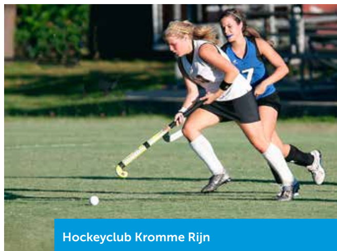
Hockeyclub Kromme Rijn

‘Een financieringsmodel op maat met een passende looptijd en aantrekkelijk rentepercentage’