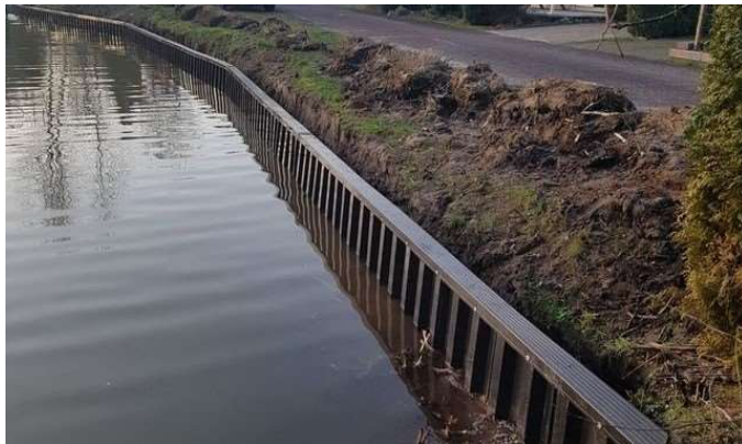
Voorbeeld kunststof beschoeiing