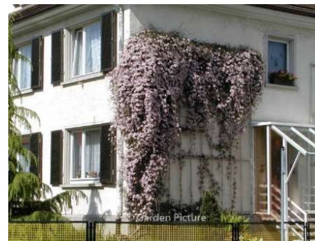
Wilde bosrank >>>