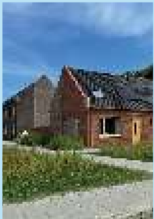
Nieuwe woningen aan de Wilgenbos.