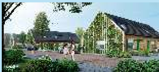
Impressie van toekomstige woningen Wilgenhof met groene gevel. Ontwerp: De Deur in Huis architect

In de Wilgenbuurt stonden alleen gezinswoningen. Na de sloop worden er twee soorten woningen teruggebouwd, levensloopbestendige woningen voor starters, minder validen of ouderen en grote gezinswoningen. De woningen zijn ontworpen door architect De Deur in Huis, met aandacht voor de omgeving en gewoontes van bewoners. Door verloop in de kleuren van de woningen worden de naastgelegen straten meer met elkaar verbonden. De zijgevels van de woningen benadrukken het open en het groene karakter. Met als blikvanger een groene gevel die straks aan de Wilgenhof wordt gerealiseerd.