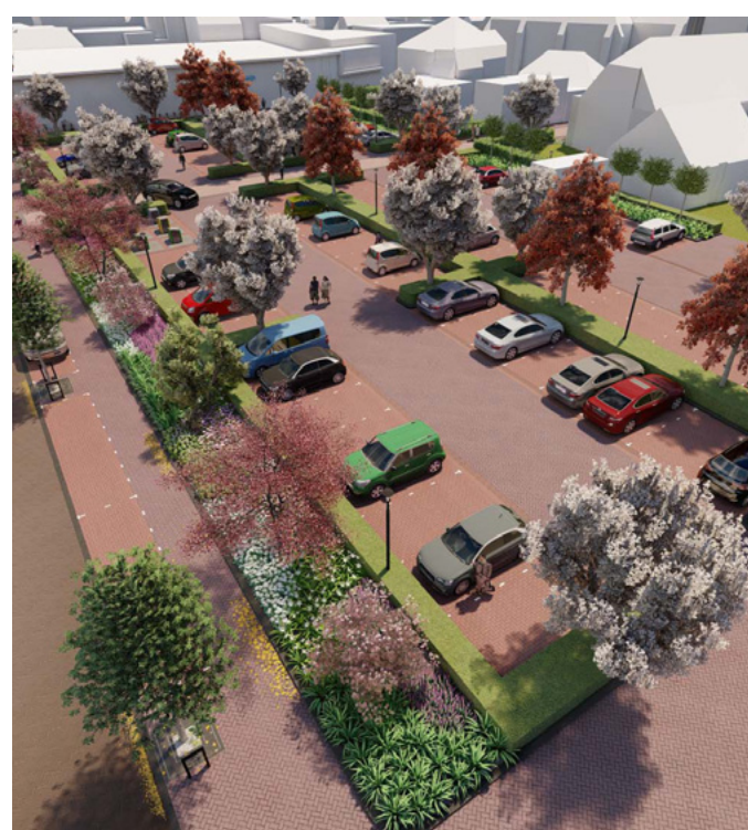
Een ander aanzicht van het nieuwe parkeerterrein (Bureau Hollema)

We hopen nog steeds dat de aannemer van de Albert Heijn in juni kan beginnen met de bouw van de tijdelijke supermarkt en dat deze eind van de zomer klaar is. In september zou de tijdelijke supermarkt dan open kunnen, waarna de sloop en nieuwbouw van de Albert Heijn kan starten.