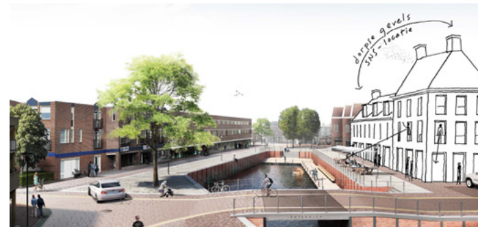
Conceptschets nieuwbouwpand op de vroegere SNS-locatie (Ziegler | Brandthorst)

We willen het Molenerf groener en duurzamer maken en onder andere een verbinding tussen de Snik en het Molenerf, het centrum aan de Blink en de Hoofdstraat maken. Daarmee maken we betere verbindingen en zichtlijnen in het centrum. Verder komt er op de vroegere SNS-locatie een aantrekkelijke nieuwe woonlocatie met appartementen en op de begane grond mogelijkheden voor horeca of detailhandel.