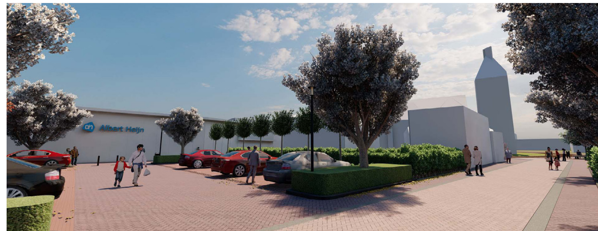
Een schets van het nieuwe parkeerterrein (Bureau Hollema)

In het centrum van Uithuizen is veel in de openbare ruimte in voorbereiding en van een deel start binnenkort de uitvoering. Allemaal met de bedoeling om de functie en uitstraling van het centrum te verbeteren. Met publiekstrekkingen aan beide uiteinden en daar tussenin vooral kleinere winkels. Hieronder leest u de laatste stand van zaken.