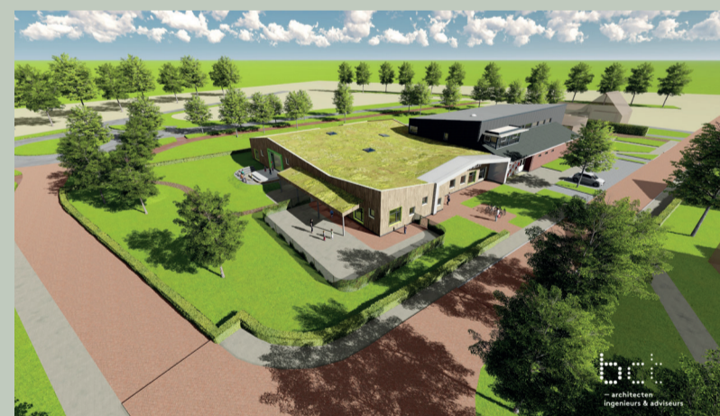
Een 3-D impressie van de 't Groenlandschool

Per gebouw is gekeken of er nieuw gebouwd of versterkt moest worden. Daarbij is met de NAM onderhandeld dat versterkingsgeld ook in nieuwbouw mag worden gestoken. Daarnaast is een bijdrage aan het Rijk gevraagd. Die is er gekomen. Vijfzeventig